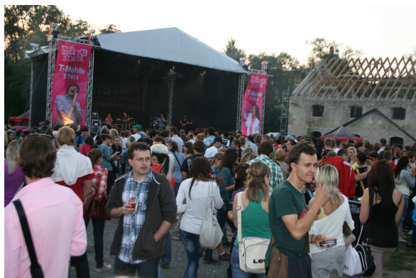
Back to School